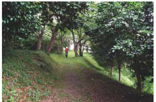
展望地へ向かう椿の林