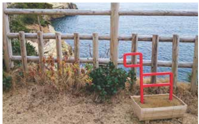
オルレの象徴“カンセ”