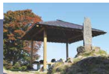
氏神様である雷神塔。 ここから御来光を 拝むこともできる。