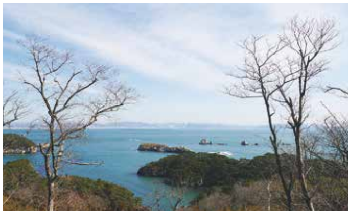
空気が澄む冬期は石巻方面への視界が開ける

標高 73.3mの観音山遊歩道を登って行くと、岩をえぐって造った潜ヶ浦 かつががうら 聖観音堂があり、さらに上に登ると東屋がある。そこからは、目の前に黒島・花魁島が見え、遠くには石巻・田代島・網地島・牡鹿半島も望め、昔は右方面に嵯峨溪が一望できたが、現在は樹木が茂り見えにくくなっている。展望台までは階段がきつく、健脚向きに思える。