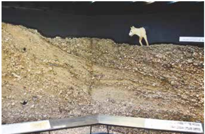
里浜貝塚貝層観察館