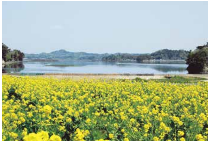
春には菜の花が咲きほこる。