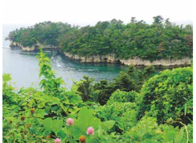
展望地からの風景

この周辺には椿の林があり、開花の時期は赤い花びらと新緑のコントラストが見事である。ここは、みやぎ椿の会が植栽したもので、震災前には宮戸の特産品おこしに地元で椿油を採取精製・管理し商品化していた。