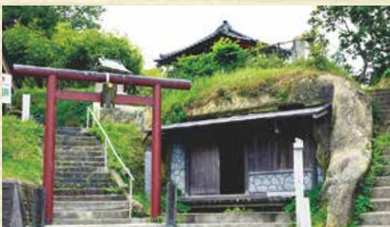
子どもたちがお籠りする岩屋

16 日の朝には、竹の棒を持ち『ホーイ、ホーイ』と叫びながら神社境内の鳥を追い払い、全行事を終わる。