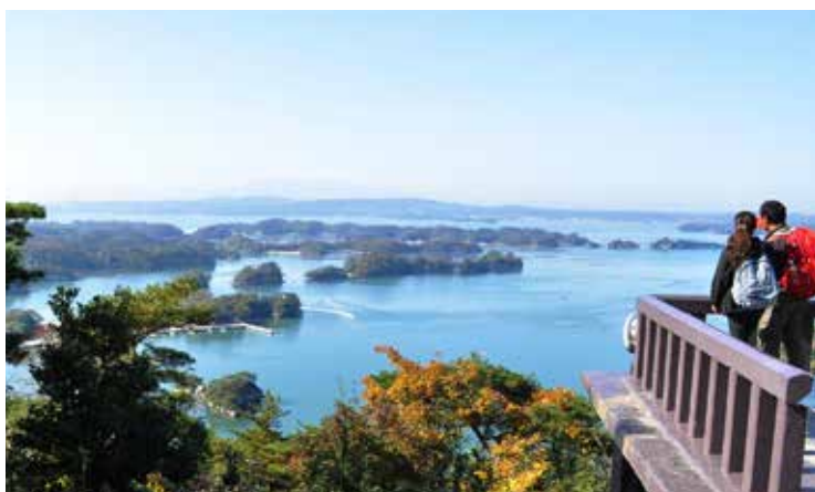
頂上展望台からの眺望