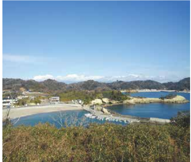
稲ヶ崎展望台から望む新浜岬