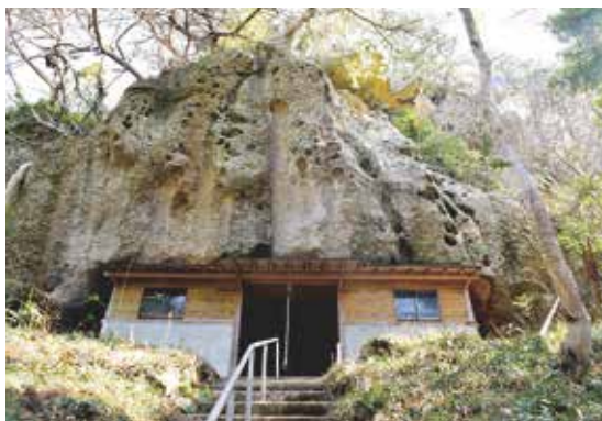
頂上途中にある潜ヶ浦聖観音堂と鐘楼