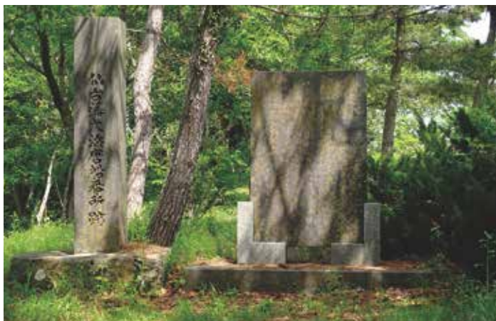
大浜唐船番所跡碑