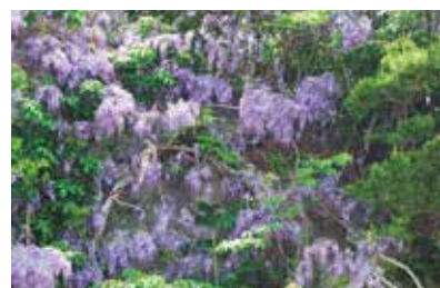
5月には藤の花が見頃を迎える