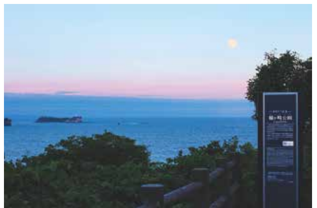
薄暮に包まれた海を望む