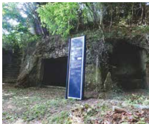
厨房とされる岩屋。隣には当時使用されていた井戸も現存している。

薬師堂までの途中に岩屋があり、これは伊達政宗がこの島に猟に来て射止めた鹿を調理した厨房と云われる。政宗が猟で獲た鹿肉を煮ようとしたところ、老僧が現れ殺生禁断の地であることから調理を禁じたが政宗は受け入れなかった。しかし鹿肉は煮えず、海中に投棄し仙台へ戻った。後日、家来に命じて狩猟の衣を着たところ、衣はすべて灰となり、以後政宗は薬師如来の靈験あらたかなるを知り、自分の眼病治療のためこの地を訪れ祈願し平癒したという。以後政宗は大いに信仰を深くし、この薬師山中腹に堂宇を建立したものとされる。医王寺住職を別当とし、寺領として田や畑、山林を寄進し、屋根に家紋を入れ代々大切にされた。現在の薬師堂は1600年後半に建て直されたものと考えられている。