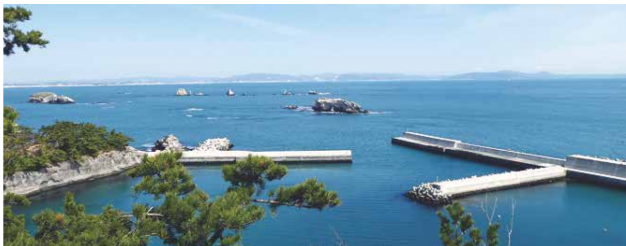
室浜地区の漁港も眺めることができる